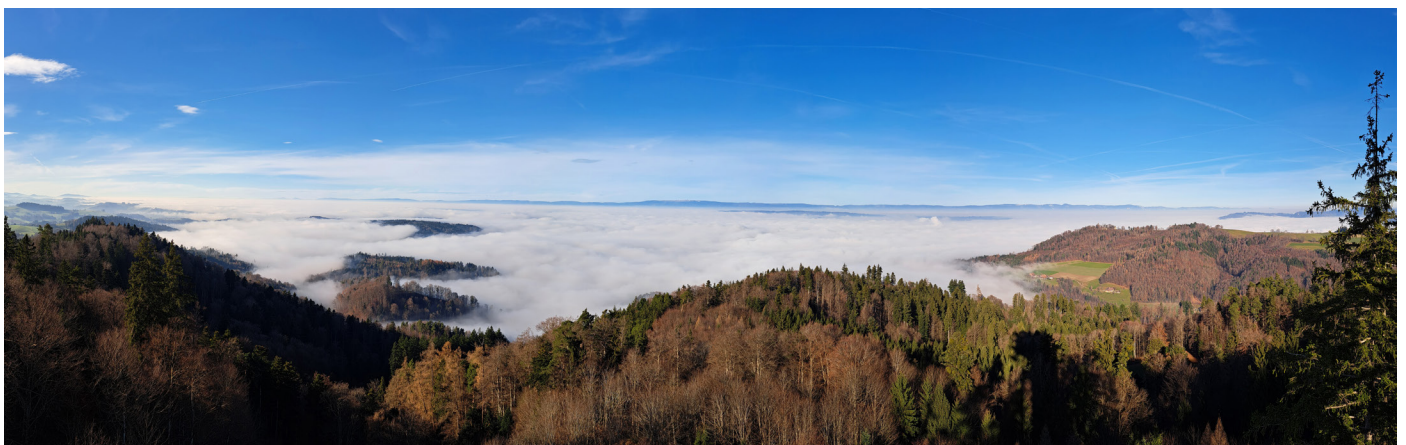
Alles im Nebel, was in Köniz passiert?

Damit die Ausgaben der Gemeinde im Vergleich zu den Einnahmen nicht wieder aus dem Ruder laufen, hat sich unsere Fraktion zusammen mit den anderen finanzpolitisch engagierten Kräften für wichtige Leitplanken eingesetzt: für die Schuldendbremse und dafür, dass die Finanzkontrolle unabhängig wird. Diese Erfolge in der beendeten Legislatur gilt es in der neuen zu sichern und umzusetzen.